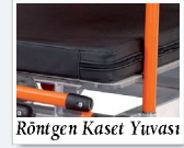
Röntgen Kaset Yuvası