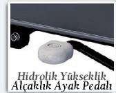
Hidrolik Yükseklik Alçaklık Ayak Pedali