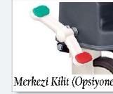
Merkezi Kilit (Opsiyonel)