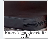
Kolay Lemzelenbilir Kilit